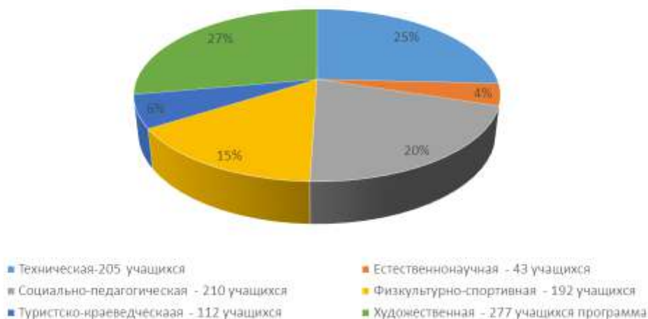
Количественный состав учащихся по направленностям